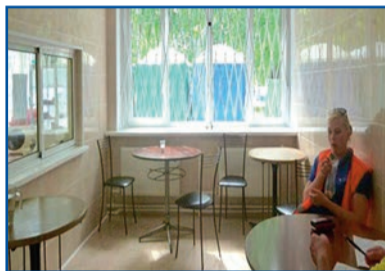
Отремонтированные помещения конечной станции «Тихорецкий проспект»

Среднемесячная заработная плата работников по сравнению с аналогичным периодом прошлого года выросла на 5%. Увеличение произошло в основном в результате повышения тарифных ставок (окладов) с 1 ноября 2014 года на 6% (по кондукторам – на 8%).